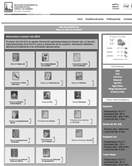
Figura 2: Página principal del sitio web de la Sección Agrometeorología de la EEAOC.

Este producto tiene como carácter distintivo la disposición de información única en su tipo en la provincia.